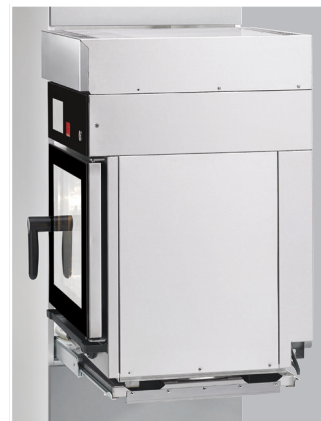
Parfait pour le service