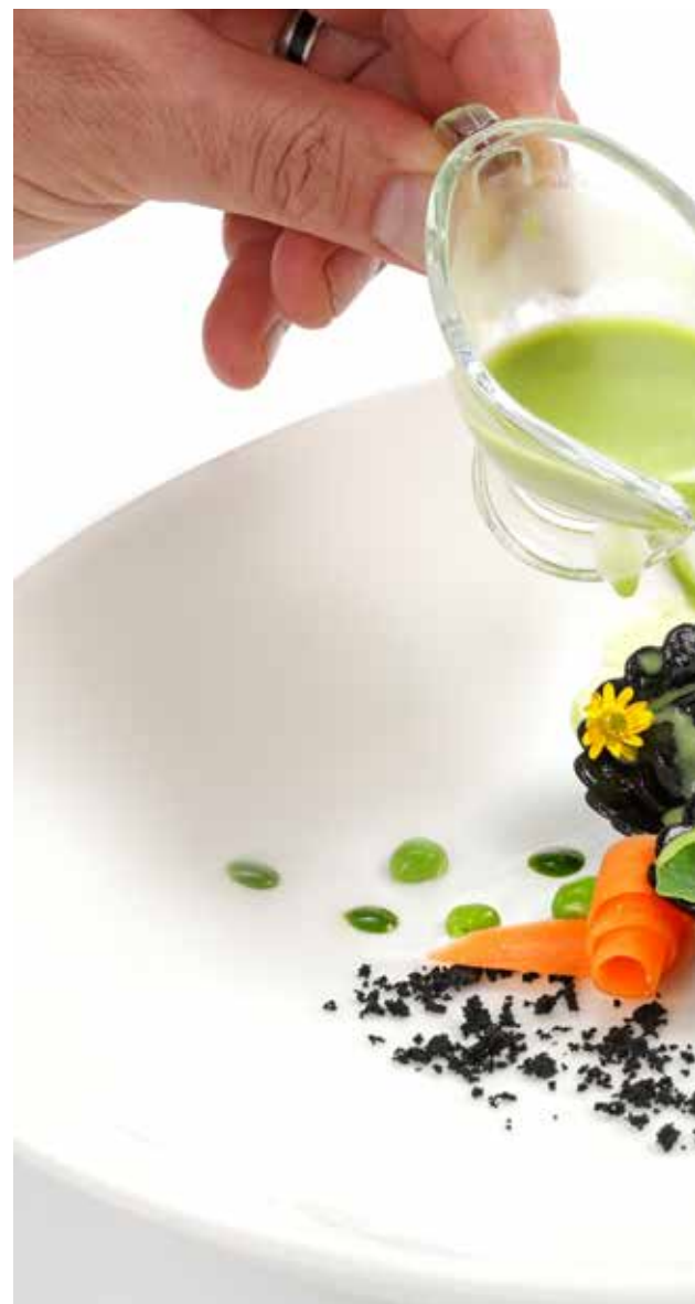
Restaurant Sichelburg, IT-Pfalzen

Die spezielle Oberflächenbeschichtung sorgt für eine komfortable und sichere Bedienung und einfache Reinigung. Minimaler Einsatz von Fettstoff und doch kein Kleben. Schnelle Reinigung dank grossen Radien.