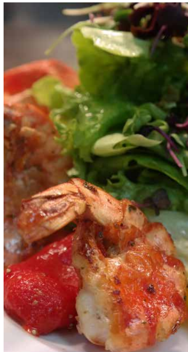
Gasthof zum Weissen Lamm, DE-Sommerach

Im Herd integriertes Fach für die geschützte Aufnahme der Induktionsgeneratoren. Der Sch(m)utzfilter ist einfach und schnell zu reinigen.