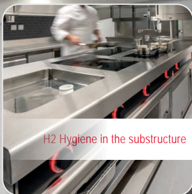
H2 Hygiene in the substructure