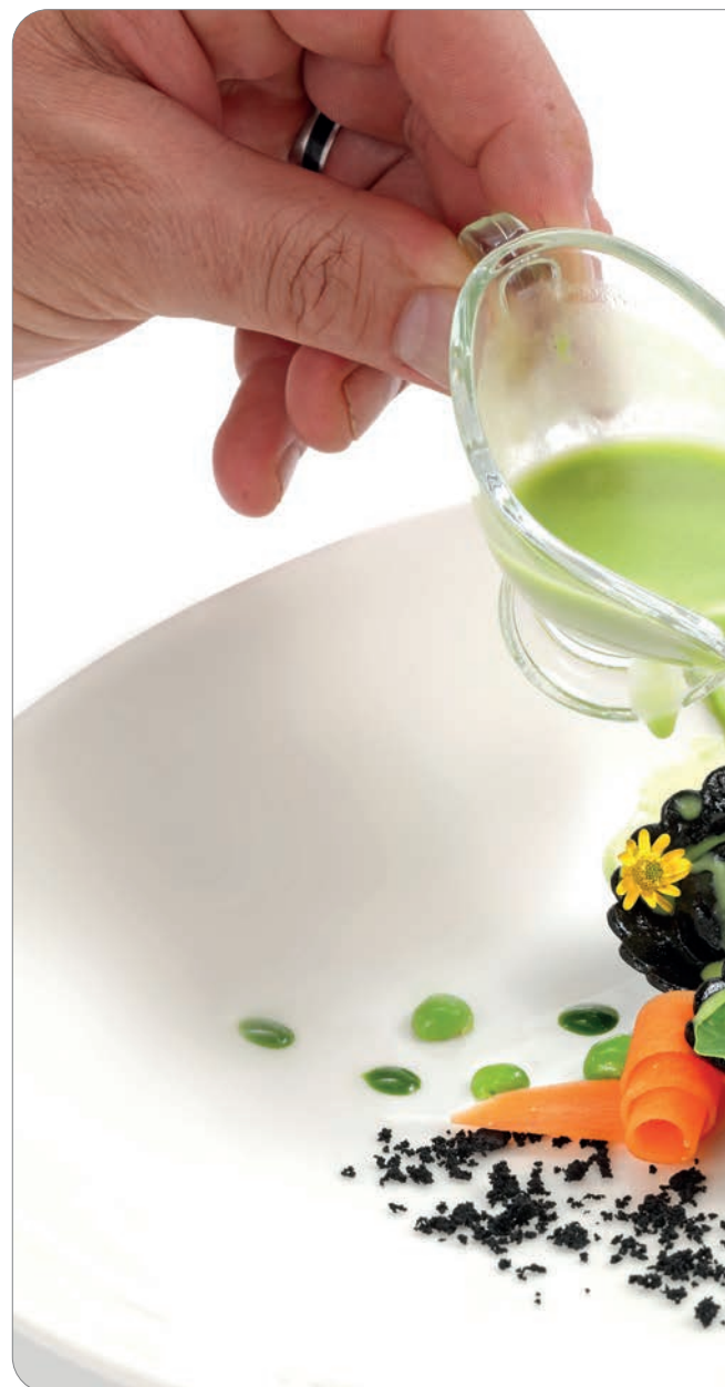
Restaurant Sichelburg, IT-Pfalzen

Die spezielle Oberflächenbeschichtung sorgt für eine komfortable und sichere Bedienung und einfache Reinigung. Minimaler Einsatz von Fettstoff und doch kein Kleben. Schnelle Reinigung dank grossen Radien.