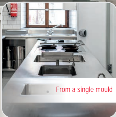
From a single mould