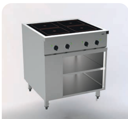
MH 200121 - Ceran mit Topferkennung

Jeder Platz in der Küche zählt. Töpfe und Pfannen im Unterbau sind schnell gerifbar.