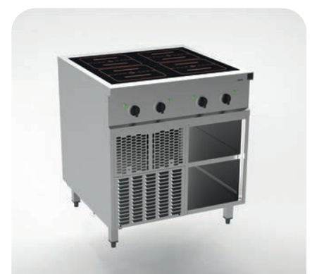
MH 200221 - Induktion 4x flächendeckend