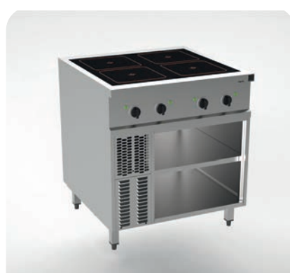
MH 200201 - Induktion 4x Rundspulen